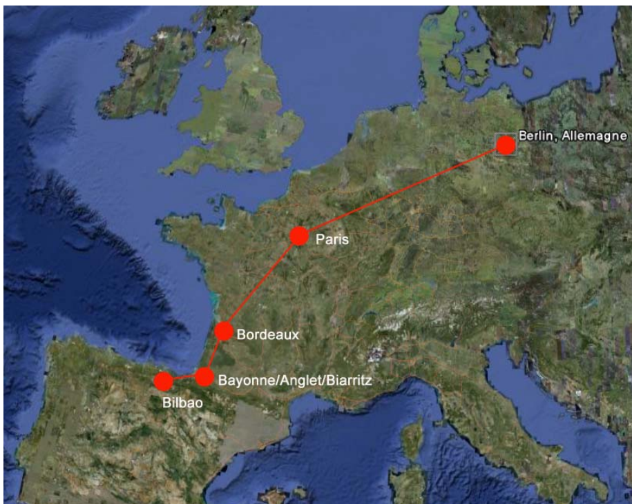
L'itinéraire dans sa globalité

Tel que l'Europe sera traversée par des artistes participants à « élément : coffre », nous voulons créer de nouveaux chemins et provoquer de nouvelles manières de penser chez le spectateur. Ce projet se comprend dans la continuité des différents itinéraires : le parcours local (exemple BAB) est le point de départ en 2009 pour amorcer le trajet national (Bordeaux, Paris) puis international (Bilbao, Berlin).